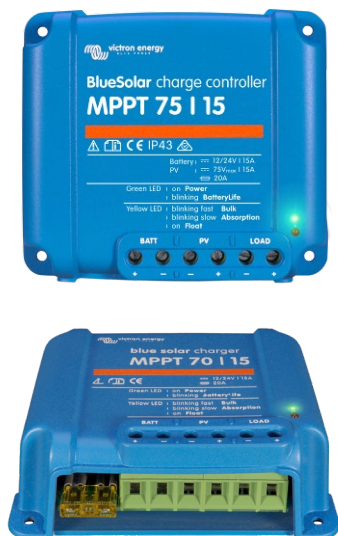
Contrôleur de charge solaire MPPT 75/15